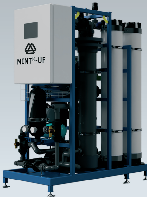
MINT ® -UF61 v provedení se všemi rozšířeními