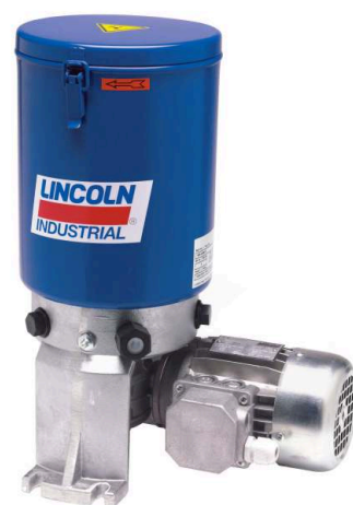
obr.: čerpadlo LINCOLN P205

System CRL 101 prodlužuje životnost kolejnic a pojezdových kol jeřábů velmi významným způsobem. Díky tomu má investice do tohoto systému návratnost několik měsíců.