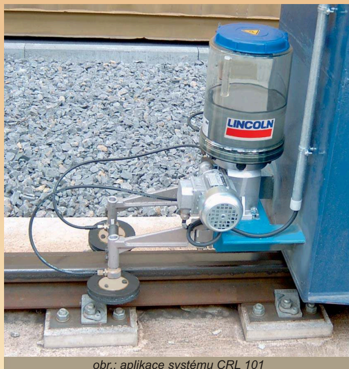
obr.: aplikace systému CRL 101