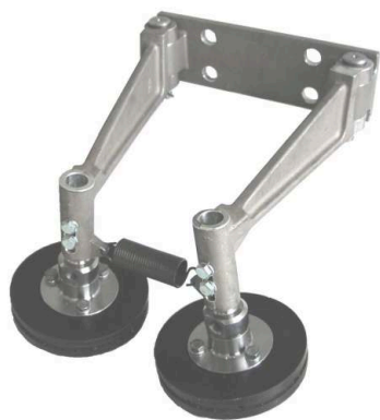
obr.: aplikátor maziva na kolejnice

Díky tomu je možné dodané množství maziva do mazacích kotoučů precizně přizpůsobit konkrétní aplikaci a ve většině případů není nutné používat žádné další přídavné elektroovládání (motor čerpadla je připojen na rozvaděč pohonu přes samostatný stykač, aby bylo čerpadlo v provozu pouze při pohybu ve směru umístění mazaného zařízení).