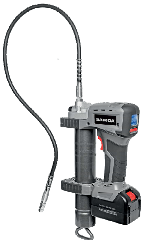
Sada AFP-S 400, obj. č. 33131

Zapsán do obchodního rejstříku u Krajského soudu v Ústí nad Labem v oddíle C, č. vložky 274