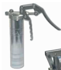
obj. č. 38132

Všechny uvedené mazací nástavce obsahují čtyřčelistovou mazací spojku určenou pro napojení na mazací hlavice kulové (typ H dle DIN 71412).