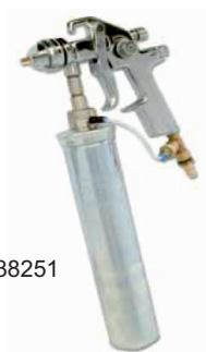
obj. č. 38251