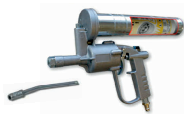
obj. č. 38201