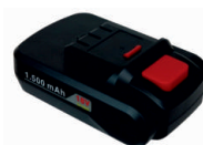
obj. č. 33154