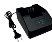
obj. č. 33153