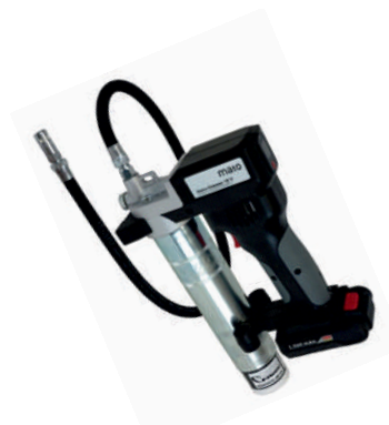
obj. č. 38321