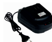
obj. č. 33152