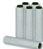
obj. č. 38801