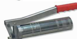
obj. č. 38102