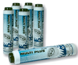
obj. č. 38822

Na přání jsou k dispozici kartuše LS naplněné dalšími typy tuků (s vyšší odolností proti zvýšeným teplotám, opotřebování, vymývání vodou atd.)