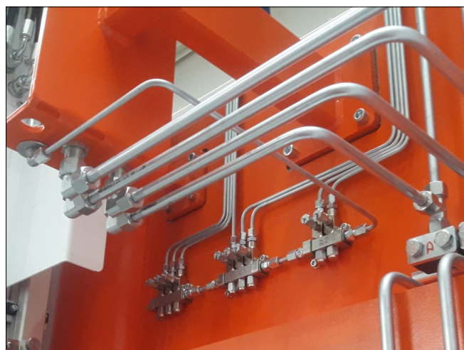
Jednopotrubní dávkovače SL-32