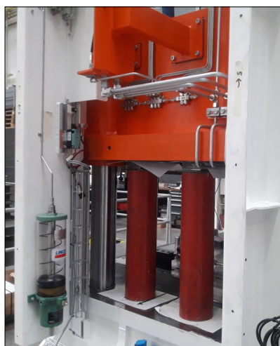
Pohled na mazací systém

Je zde použit jednopotrubní systém Centro-Matic. Zdrojem tlakového maziva je pneumatické jednozdvihové čerpadlo CM 83668. Dávkování zajišťují jednopotrubní dávkovače SL-32. Množství maziva dodaného do jednotlivých mazaných míst je možné regulovat přímo na dávkovačích a dále frekvencí cyklů systému.