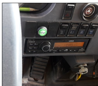
Prosvětlené tlačítko v kabině strojníka