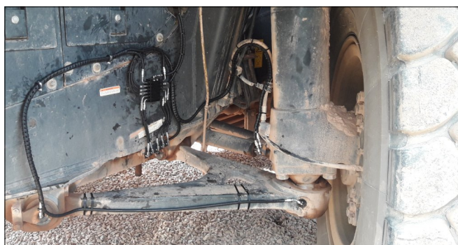
Jeden ze sekundárních rozdělovačů SSV