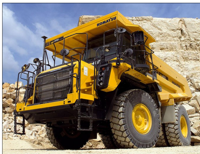
Celkový pohled na stroj (ilustrační foto)