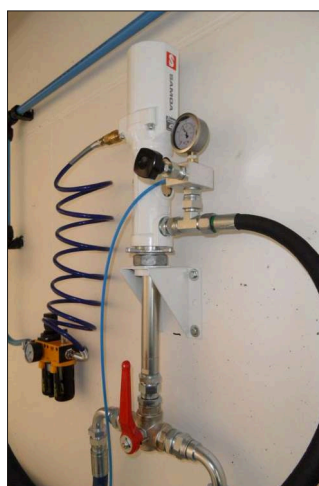
Čerpadlo PumpMaster 4 s příslušenstvím Na sací části sací jednotka s prepínáním na dva kontejnery. Na výtlaku pojistný ventil s přepadem a s manometrem.