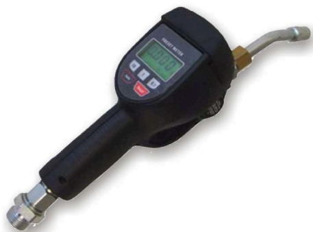
Výdejní pistole s předvolbou