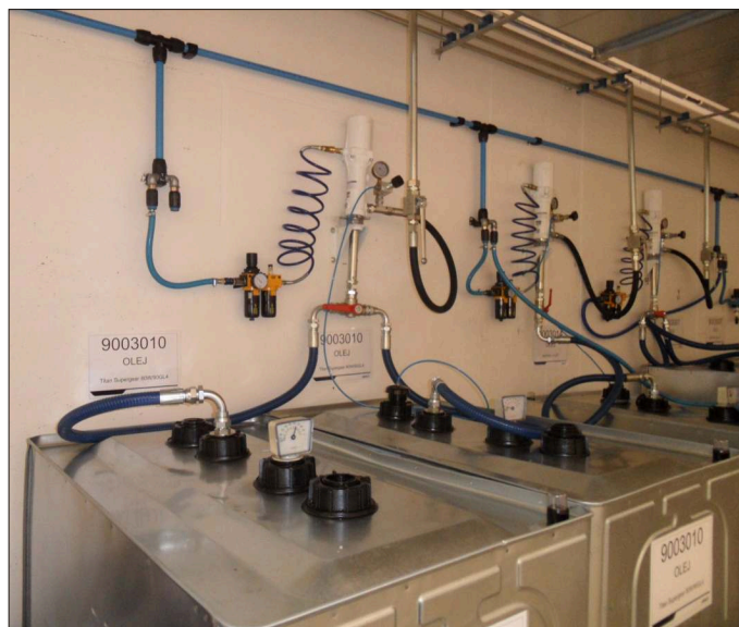
Kontejnery 1000 l umístěné ve skladu maziv, pneumatická čerpadla na nástěnných konzolách, jedno z čerpadel má prepínací sací jednotku pro dva kontejnery

Ve skladu maziv jsou oleje skladovány v kontejnerech o objemu 1000 l. U každého kontejneru je na konzole na zdi umístěno pneumatické čerpadlo PumpMaster 4 s příslušenstvím, které automaticky doplňuje olej v centrálním rozvodu v závislosti na jeho odběru výdejními pistolemi. System tedy nevyžaduje žádné elektroovládání.