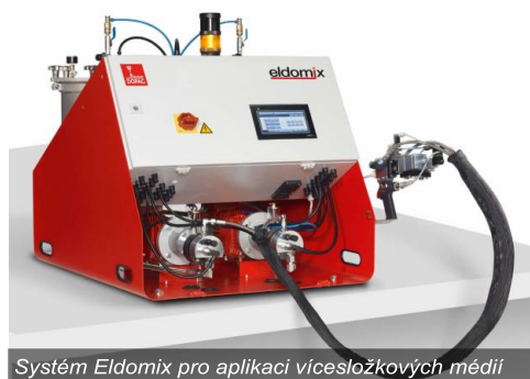
Systém Eldomix pro aplikaci vičesložkových médií