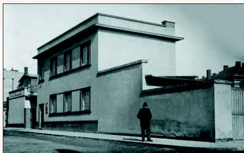
Foto: Původní budova firmy H. A. Hennlich v Duchcově

Vývoj po roce 1989, kdy padly komunistické režimy ve střední a východní Evropě, využila firma HENNLICH nejen k návratu do Československa, ale také ke své expanzi do dalších zemí regionu. V průběhu více než 20 let prošla bouřlivým rozvojem. V mnoha zemích, ve kterých působí, se skupina HENNLICH stala důležitým dodavatelem pro průmyslové podniky. Počet zemí ve kterých skupina HENNLICH operuje se neustále rozšiřuje, stejně jako portfolio produktů a podíl výroby vlastních výrobků. □