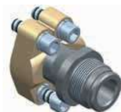
Adaptér HFS s připojením AG 2" a SAE výstupem

Výrobní tolerance nejsou zohledněny. Změny vyhrazeny.