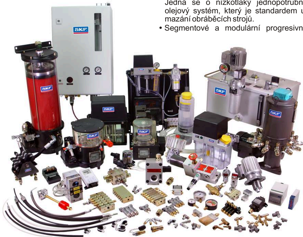
obr.: komponenty mazacích systémů SKF z programu VOGEL (již zaniklá značka)

V příštích vydáních CEMA-TECH Info Expressu si tyto "nové" systémy budeme postupně představovat. □