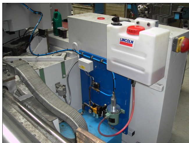
Panel s čerpadlem, pneumatickými prvky a elektroovládáním, nahoře externí zásobník s olejem