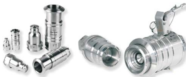
WALTHER-Clean-Break-Ballface-Kupplung Serie BF WALTHER Clean Break Ball-Face Coupling Series BF