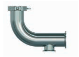
Výstupní potrubí s odkalením