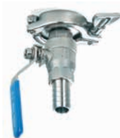
Kulový ventil TC 1,5" + clamp