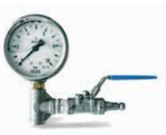
Manometr s odvzdušněním