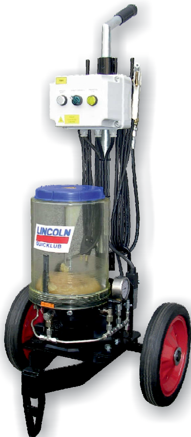
Pojízdný mazací přístroj AM 203, obj.č. 924101 08

Zapsán do obchodního rejstříku u Krajského soudu v Ústí nad Labem v oddíle C, č. vložky 274