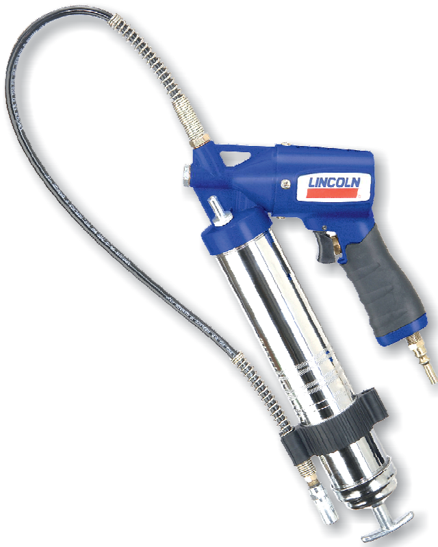
Pneumatický mazací lis 1162, obj.č. 32101

Zapsán do obchodního rejstříku u Krajského soudu v Ústí nad Labem v oddíle C, č. vložky 274