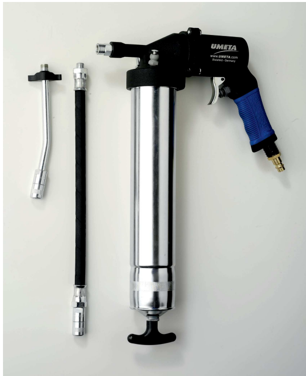
Pneumatický mazací lis DRP 30, obj.č. 32111

Zapsán do obchodního rejstříku u Krajského soudu v Ústí nad Labem v oddíle C, č. vložky 274