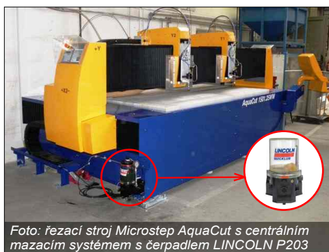
Foto: řezací stroj Microstep AquaCut s centrálním mazacím systémem s čerpadlem LINCOLN P203

Tento typ systému, ve spojitosti s čerpadlem P203, je vhodný pro menší až střední zařízení s počtem mazaných míst obvykle do cca 40, s menší až střední spotřebou maziva.