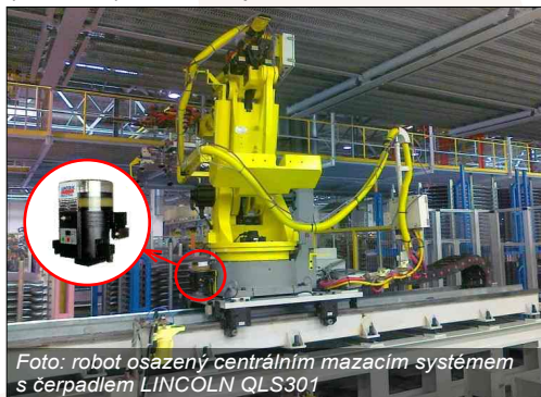
Foto: robot osazený centrálním mazacím systémem s čerpadlem LINCOLN QLS301

Tento typ systému, ve spojitosti s čerpadlem QLS301, nachází své uplatnění u menších zařízení s malým počtem mazaných míst (max. 18) s malou spotřebou maziva.