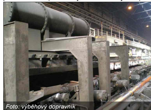
Foto: výběhový dopravník

Tento typ systému je určen pro mazání velmi rozsáhlých zařízení s až několika tisíci mazanými místy ve velmi nepříznivých podmínkách (válcovny, cementárny atd.).