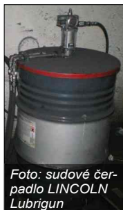
Foto: sudové čerpadlo LINCOLN Lubrigun

Dávkování tuku zajišťují u tohoto systému dvoupotrubní dávkovače VSG a VSL, přičemž u