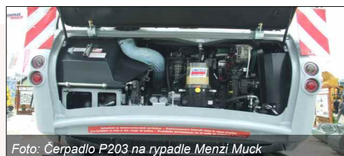
Foto: Čerpadlo P203 na rypadle Menzi Muck

Všichni návštěvníci našeho stánku obdrželi informace o nesporných přínosech instalace centrálního mazání LINCOLN na stavební stroje, které jsme dále doplnili o informace o mazací a garážové technice. Naše centrální mazací systémy si