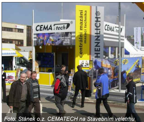
Foto: Stánek o.z. CEMATECH na Stavebním veletrhu

návštěvníci mohli prohlédnout i "naživo" na dvoucestném rypadle New Holland na stánku firmy Agrotec a na kráječícím rypadle Menzi Muck na stánku firmy STAVOPLAST KL a dalších.