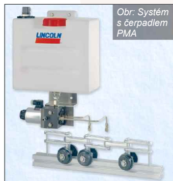
Obr: Systém s čerpadlem PMA

2) PMA je čerpadlo, jehož výtlačný zdvih je aktivován elektromagnetem. Slouží k napojení 1 - 6 mazaných bodů. V případě deskových dopravníků - např. ve ŠKODA Auto, v závodech v M.B. i v Kvasinách, a dále v TPCA jsou těmito čerpadly s využitím speciálních