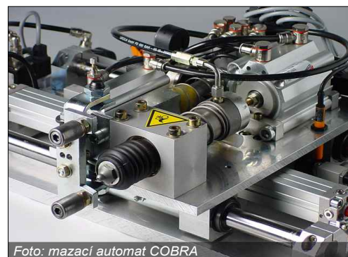
Foto: mazací automat COBRA

1) COBRA je mazací automat, který je určen k automatickému mazání čepů