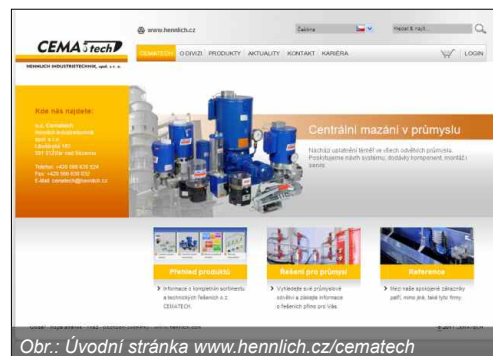
Obr.: Úvodní stránka www.hennlich.cz/cematech

Společnost Hennlich Industrietechnik spustila nový web.