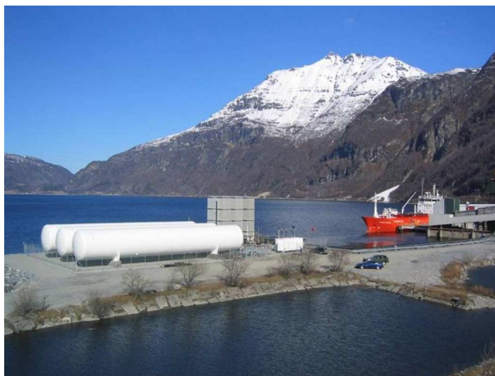
zásobník LNG 4.200 Nm 3 /h