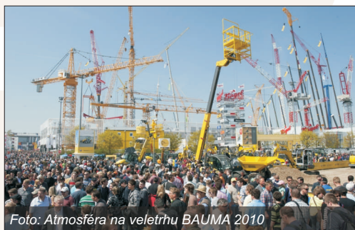
Foto: Atmosféra na veletrhu BAUMA 2010