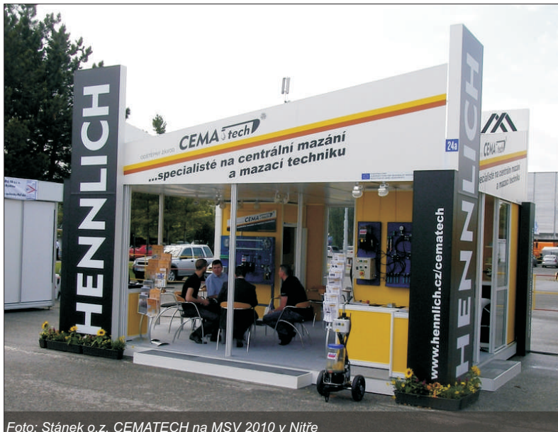
Foto: Stánek o.z. CEMATECH na MSV 2010 v Nitre