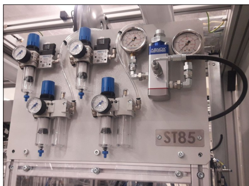
Pneumatické prvky a regulátor tlaku maziva