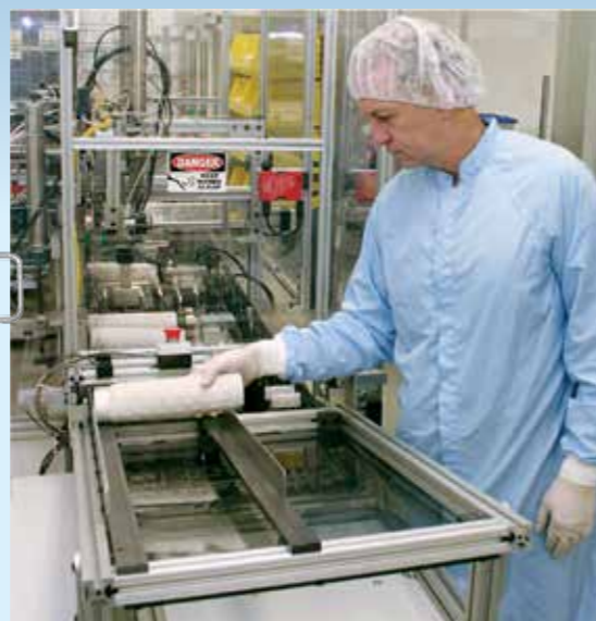
Procesní filtry jsou vyvíjeny nejmodernější výrobní technologií.