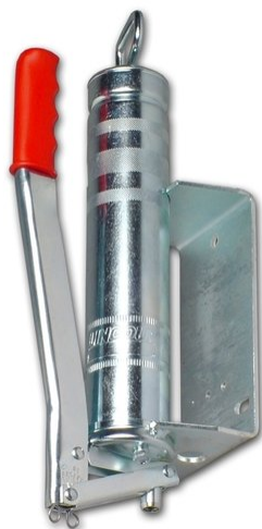
Ruční čerpadlo HP500W

Mezi lety 2002 až 2015 bylo tímto mazacím systémem u zákazníka postupně vybaveno cca 300 vulkanizačních lisů.